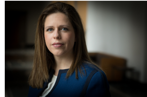
Carola Schouten minister van Landbouw, Natuur en Voedselkwaliteit

'Vertrouwen in de toekomst' is het motto van dit kabinet. Ik heb er veel vertrouwen in dat we toe kunnen werken naar kringlooplandbouw, en dat we daar samen met boeren, tuinders en vissers, andere ondernemers en maatschappelijke partijen onze weg in vinden.